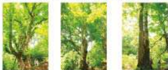
巨木3兄弟(柵・ブナ・沢グルミ)