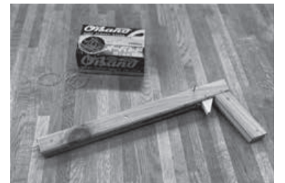
ゴム鉄砲イメージ

日時：8月14日(日) 9:00から 会場：町民センター 大ホール 定員：10名程度 参加費：1人300円（おやつ景品あり） 締切日：8月11日(金) 申込先：生活工芸館 ☎48-5502