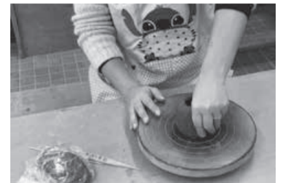
手びねりイメージ

日時：7月23日(土) 10:00から 会場：生活工芸館 陶芸室 定員：6組（親子等ペアでの参加も可） 参加費：1,500円 締切日：7月20日(水) 申込先：生活工芸館 ☎48-5502