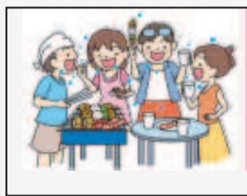
場面③マスクなしでの会話