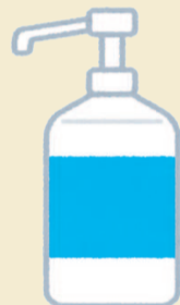
アルコール消毒液