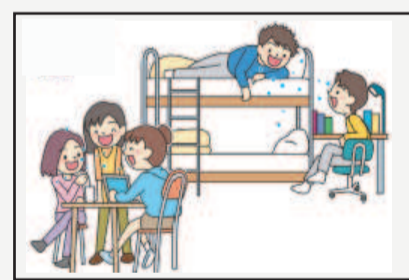
場面④狭い空間での共同生活