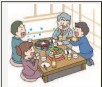
場面①飲酒を伴う懇親会等