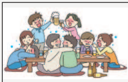
場面②大人数や長時間に及ぶ飲食